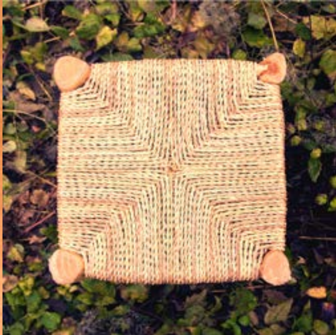
HARVEST - TRICO 07